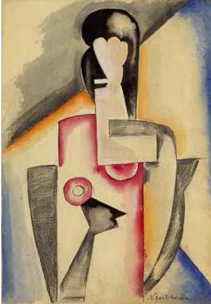
NATALIA GONTCHAROVA Nagaevo bei Tula 1881-1962 Paris