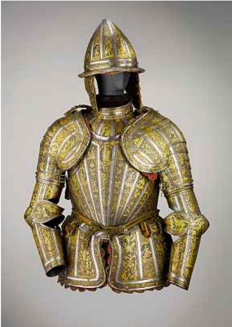
Prunkharnisch, ital. um 1580 Pompeo

Verkauft im September 2009 für CHF 798'000 | EUR 532'000 | USD 725'455 (inkl. Aufgeld) Auktion 405, Kat.-Nr. 303